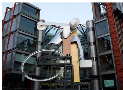
Installation inför Paralympics, Storbritanien.