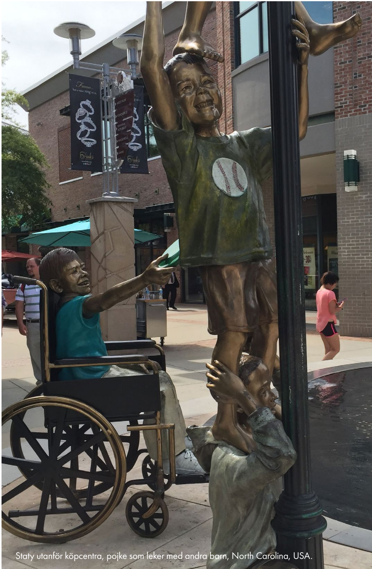
Staty utanför köpcentra, pojke som leker med andra barn, North Carolina, USA.