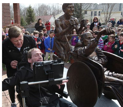
Staty med pappa som med sin son sprang Boston marathon, USA.