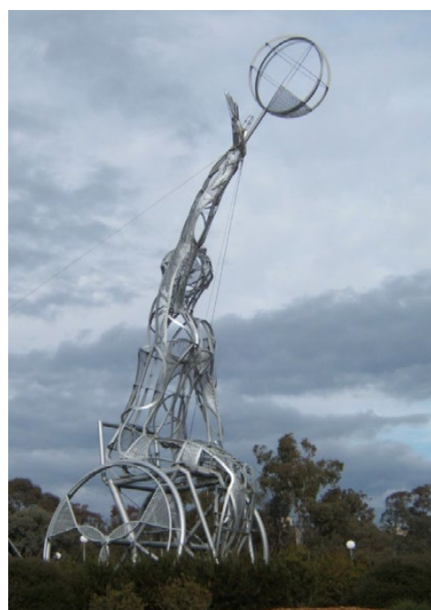
Ramverk av basketspelare, vid Institute of sports, Australien.